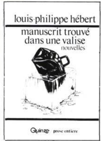
Manuscrit trouvé dans une valise (Louis-Philippe Hébert) 175 pages, $6.95

Ces entretiens avec l'un des musiciens les plus notoires de Québec font revivre le monde musical du début du siècle, à l'époque des premiers prix d'Europe et des « p'tits chars » qui bringuebalaient dans les rues de la Vieille Capitale. Il s'agit là d'une contribution importante à la petite et à la grande histoire de la musique au Québec.